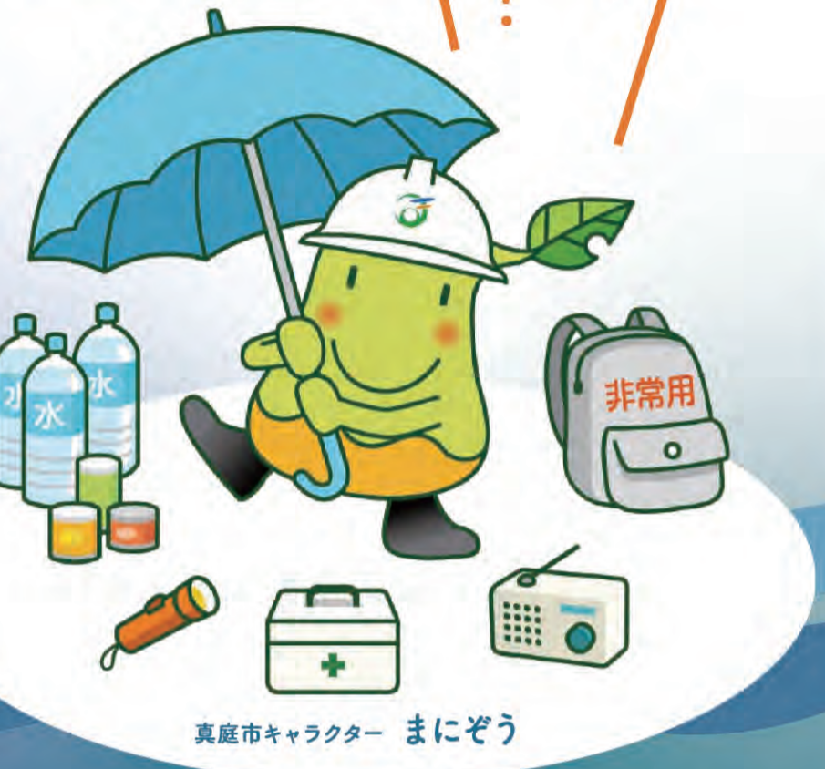
真庭市キャラクター まにぞう